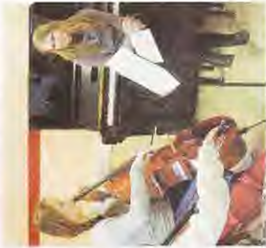
Un momento della scorsa Masterclass