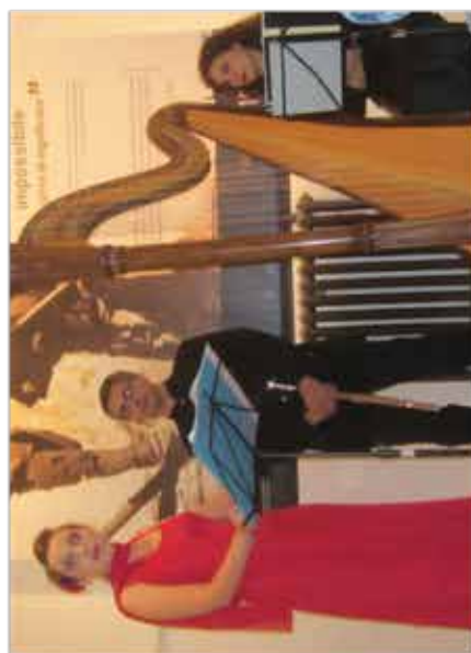
Vari momenti del Festival Le Altre Note, che ha toccato molti paesi della Valtellina nell'ultimo mese

SONDRIO (cvb) Quest'anno il Valtellina Festival Le Altre Note ha superato se stesso, sia per il tipo di messaggio culturale, sia per la qualità e la professionalità di artisti e docenti, sia per l'affluenza dei giovani iscritti alla Masterclass e per il riscontro avuto dalle comunità, dalle istituzioni e dai privati che lo hanno supportato durante i 30 eventi di alto livello, offerti dal 10 agosto al 13 settembre. Che sia stata un'edizione speciale non c'è alcun dubbio. Anche per il tema scelto attorno al quale tutta la manifestazione è ruotata con evocazioni e proposte. Oltre i confini - titolo opportuno in terre di confine come la Valtellina, la Valchiavenna e la vicina Svizzera - che alla luce delle innumerevoli inquietudini e dei grandi drammi che attanagliano la contemporaneità, ha proposto elementi di riflessione riguardanti i confini che l'uomo si pone o subisce, e con la potenza della musica che abbate ogni barriera culturale, naturale ed umana. Il progetto del Festival è frutto di un lavoro comunitario e impegnativo degli organizzatori che ogni anno investono in se stessi e nelle loro conoscenze con maggior do-