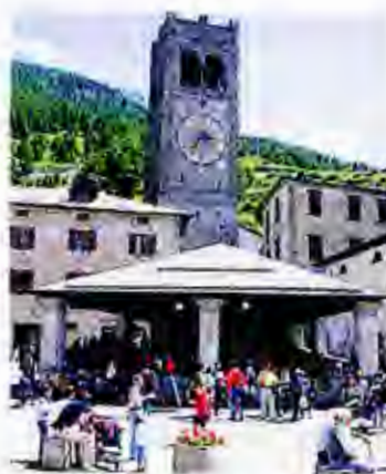
Un concerto sarà domani al Kuerc

Realizzati in collaborazione con le istituzioni locali, l'associazione Mozart Italia e lo Stiftung Mozarteum Salzburg, fondazione dedicata al genio austriaco con sede a Salisburgo, vedranno protagonista l'Ensemble AudiMozart - formazione che raccoglie i vincitori del concorso internazionale premio Mozart di Rovereto -, accompagnata dalla partecipazione straordinaria del clarinettista Dimitri Ashkenazi, figlio del grande pianista Vladimiri Ashkenazi. Con un programma che esula dalla linea programmatica del festival, gli artisti accosteranno a straordinarie pagine di Mozart i lavori di autori del Novecento storico come il compositore e direttore d'orchestra austriaco Alexander von Zemlinsky ed altri con-