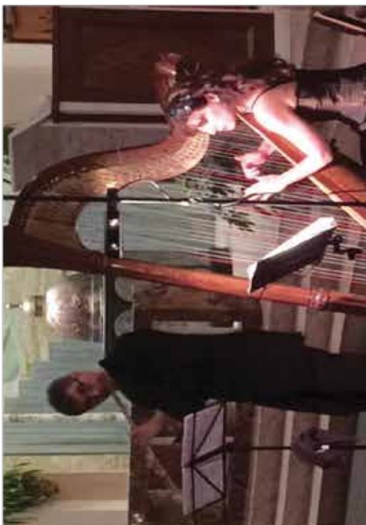
Un momento del concerto «Svegliati Europa»