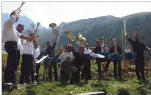
ALL'APERTO Bel momento di uno dei concerti di Le Altre Note