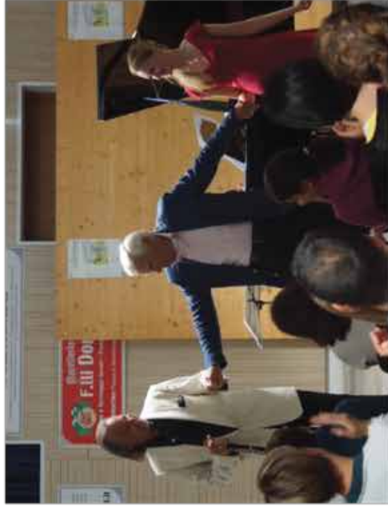
Due momenti delle serate di questa settimana del Festival Le Altre Note