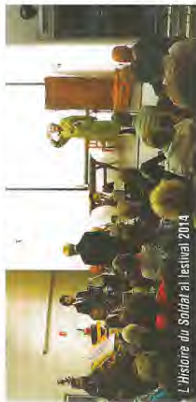
L'Histoire du Soldat al festival 2014

pittura estemporanea di Fathi Hassan e del contributo esecutivo degli allievi e docenti della Masterclass LeAltreNote; il concerto dell'Ensemble Nord-Sud, gruppo che unisce dieci tra i migliori allievi dei Conservatori « Giuseppe Verdi » di Como e « Arcangelo Corelli » di Messina; l'Orchestra Sinfonica di Sanremo che, dopo oltre sessant'anni dalla prima esecuzione, riproporrà il Concerto dell'Alderina di Giorgio Federico Ghedini. Il Festival potrà anche contare sul grande disegnatore Sandro Dossi per l'immagine del cartellone. Per ulteriori informazioni: www.lealtrenote.org .