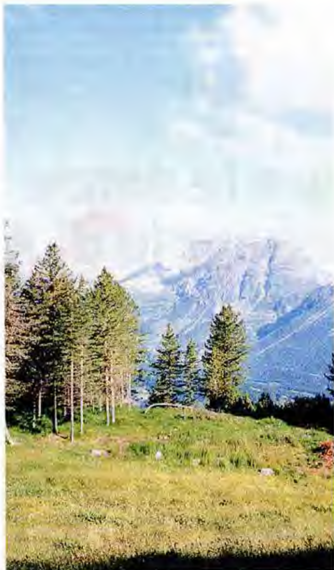
La natura dell'Alta Valle "omaggiata" dalla musica de Le AltreNote

Questi sono solo i primi appuntamenti di una ricca serie di concerti in calendario fino al prossimo 15 settembre, per la maggior parte in Alta Valle. ■