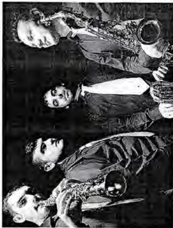
La formazione dell'Omnia Sax Quartet

L'appuntamento, possibile grazie alla collaborazione del Parco Nazionale dello Stelvio,