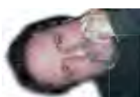
Fabrizio De Rossi Re Improvisazione - Composizione

Email info@lealtrenote.org Tel. +39.347.4467780