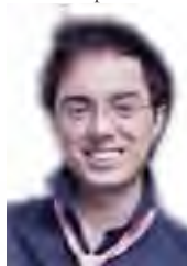
Alessandro Marangoni Pianoforte